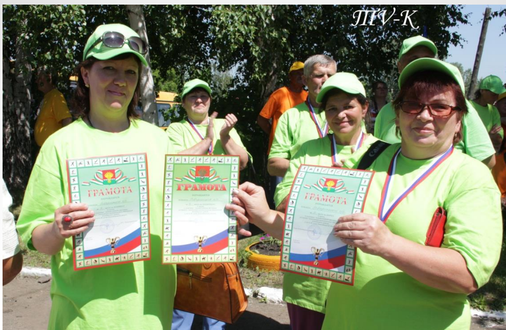
Призеры 7 спортивно-художественного фестиваля. Команда ветеранов Поваренского сельсовета.