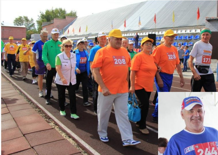
Ветераны-пенсионеры Кочневского района, сдача нормативов ГТО