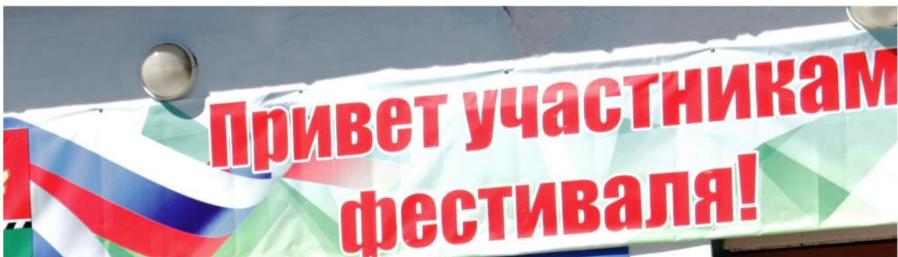
Призеры седьмого летнего спортивно-художественного фестиваля