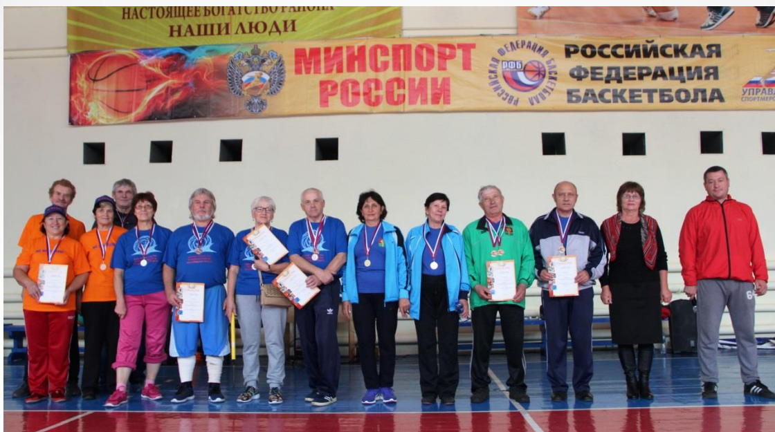
Декада пожилых людей -2017, Медалисты.