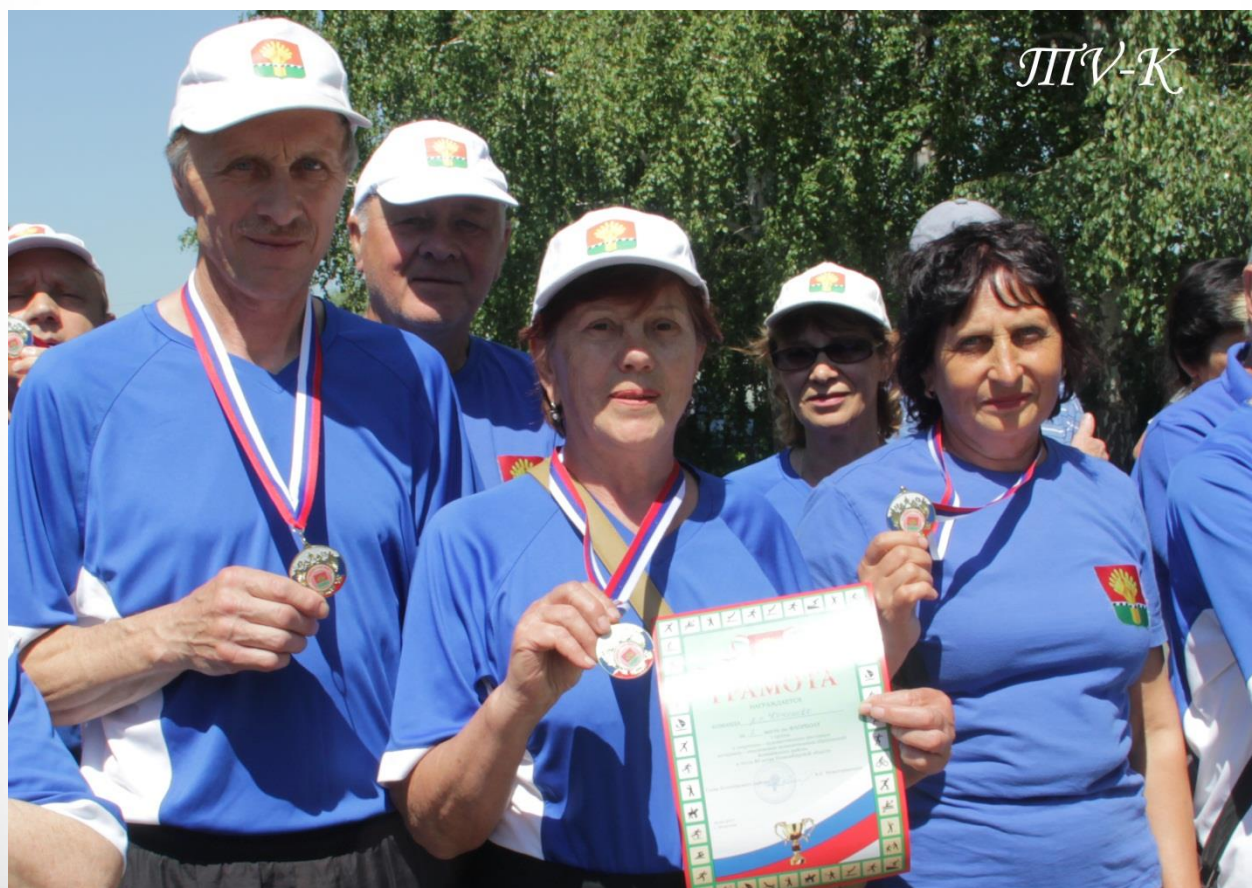
Команда ветеранов р.п.Коченево впервые заняли третье место в спортивных соревнованиях в Федосихе.