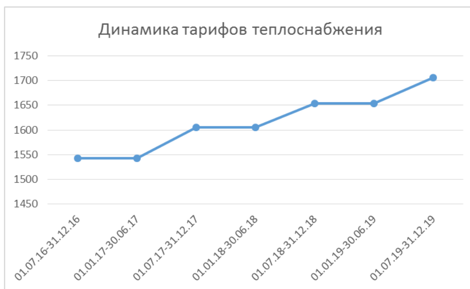
Рисунок 4 - Динамика утвержденных тарифов МУП «Чикское ППЖКХ» на тепловую энергию за 2015-2019 гг.

Плата за услуги по поддержанию резервной тепловой мощности, в том числе для социально значимых категорий потребителей в МУП «Чикское ППЖКХ» не утверждена.