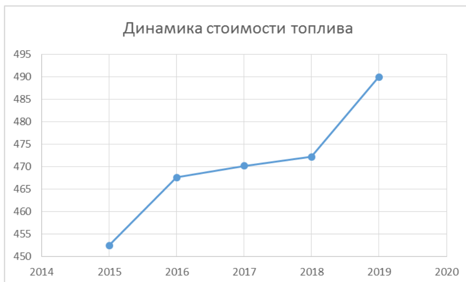
Рисунок 2 - Динамика стоимости используемого топлива, тыс. руб.