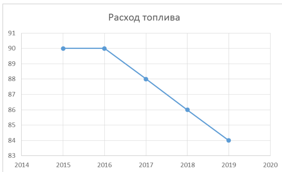
Рисунок 3 - Годовой расход газа на выработку тепловой энергии, , тыс. м 3