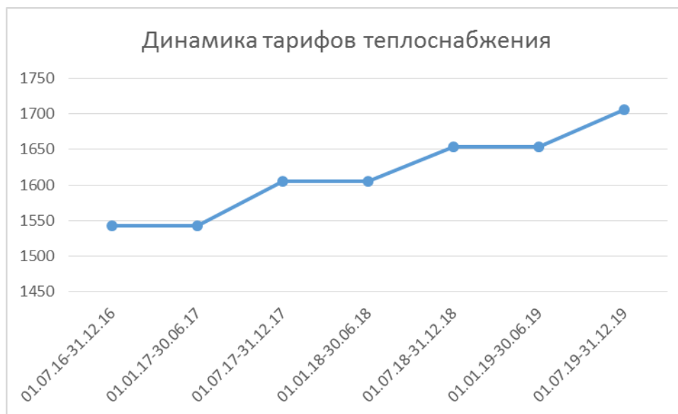
Рисунок 1 - Динамика утвержденных тарифов МУП «Чикское ППЖКХ» на тепловую энергию за 2015-2019 гг.

Плата за услуги по поддержанию резервной тепловой мощности, в том числе для социально значимых категорий потребителей в МУП «Чикское ППЖКХ» не утверждена.