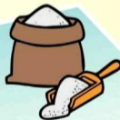
остывшая и упакованная зола