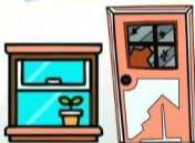
отходы от текущего ремонта