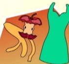
остатки пищи, товары потребления